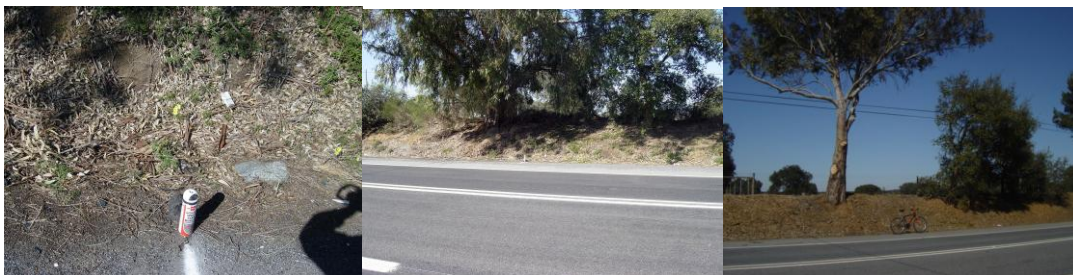
Ponto B 38°40,3479N 8°08,8032W