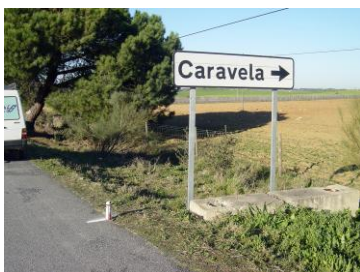
Ponto A 38°40,2128N 8°09,1005W

Ponto B 500 metros sentido Montemor, Arraiolos sem pontos de referencia. 38°40,3479N 8°08,8032W