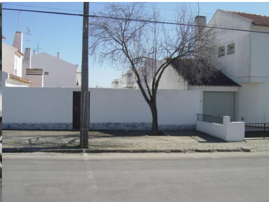
Chegada 10 Km