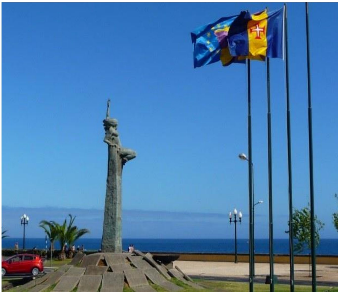
Praça da Autonomia - Funchal